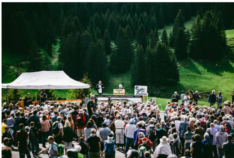
CRHA 2018 crédit photo Malacrida

Michel ETIEVENT Historien social, biographe d'Ambroise Croizat et fidèle des Glières.